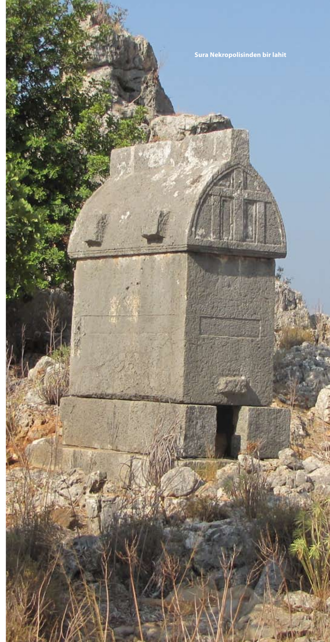
Sura Nekropolisinden bir lahit